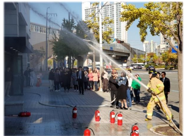
사고 예방을 위한 정기 소방훈련 실시