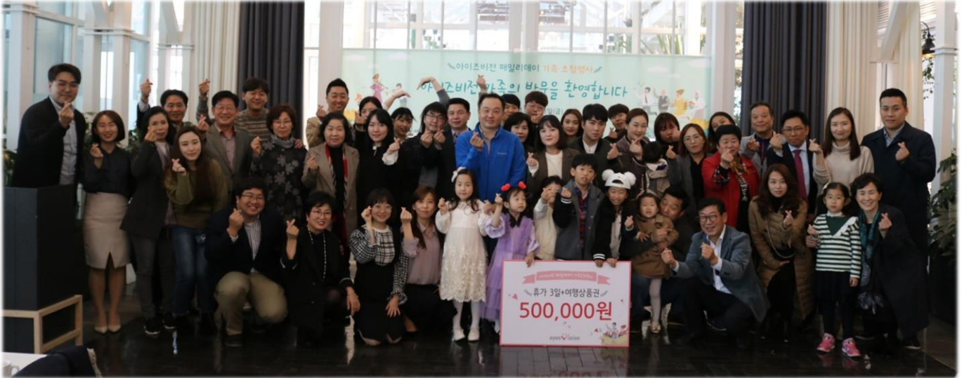
임직원 가족과 함께하는 패밀리 데이 행사