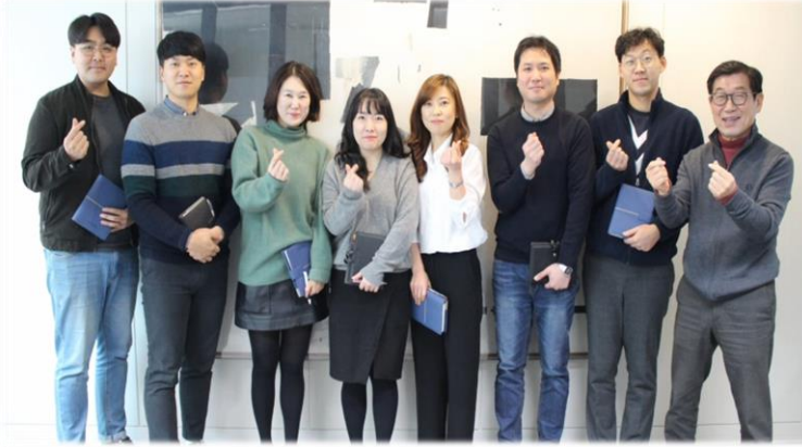
즐거는 인재 (비전 7인) - 차기 리더 육성 시스템