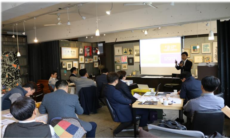
가치관 경영 정착을 위한 계층별 정기 워크숍